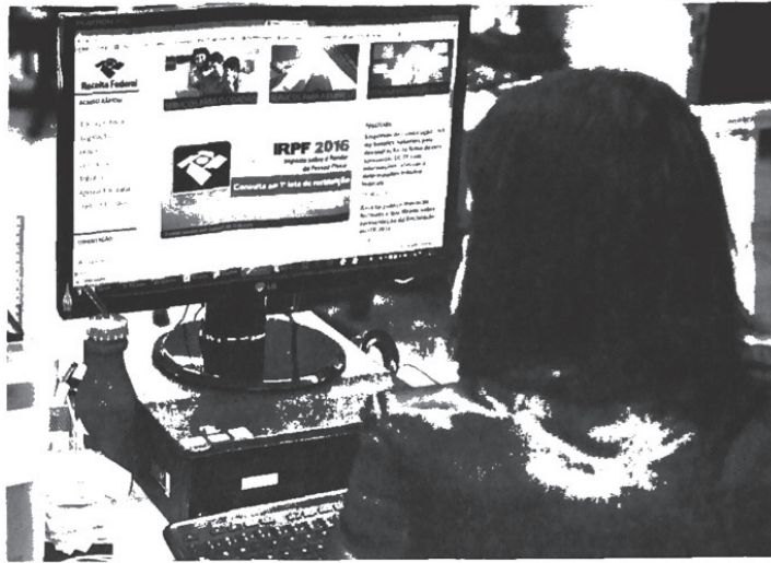
RESTITUIÇÃO Para saber se o seu nome está no primeiro lote, contribuinte deve acessar o site www.receita.fazenda.gov.br

"As pessoas precisam aprender que dá para poupar e a investir o dinheiro da melhor forma", conclui.